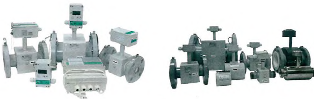
Рисунок 1 - Общий вид расходомеров-счетчиков электромагнитных РСЦ

Общий вид расходомеров-счетчиков электромагнитных РСЦ приведен на рисунке 1.